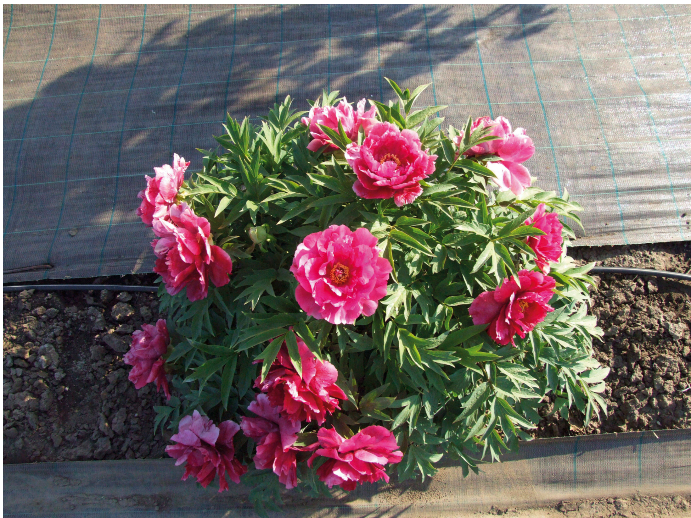
Obr. 1: Habitus dřeviny Paeonia suffruticosa

Pivoňka keřovitá představuje široký komplex původních typů. Vyskytují se v obrovském rozsahu v Čínských provinciích Anhui, Gansu, Henan, Shanxi, Sichuan a Yunnan. Velmi často je lze nelézt poblíž klášterů, kde byly pěstovány pro okrasnou a léčivou funkci. Dřevité pivoňky byly pěstovány v Číně po více než 1500 let a do současnosti tam bylo uznáno více jak 500 kultivarů. Byla poprvé popsána v roce 1804 na základě rostlin pěstovaných v anglických zahradách. Do Evropy byly první rostliny dovezeny v roce 1787. Kulturní dřevitá pivoňka s květy plnými, poloplnými a vzácně jednoduchými nejrůznějších barev v odstínech od bílé přes růžovou po tmavě červenou.